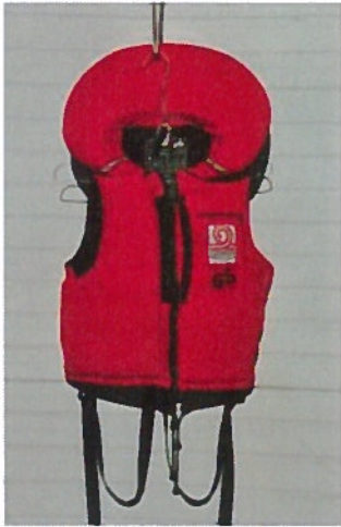
Rettungswesten mit Kragen Gilet de sauvetage avec col Giubbotti di salvataggio con collo

Auftrieb von mindestens 75 N / Poussée hydrostatique d'au moins 75 N / Spinta idrostatica di almeno 75 N