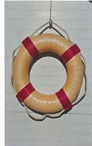
Rettungsring Bouée de sauvetage Salvagente anulare